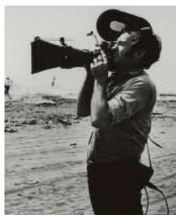
Les vacances du cinéaste, 1973